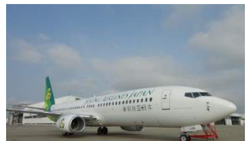
春秋航空日本的B737-800型机。