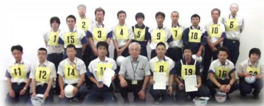
在表彰仪式上，塚原社长和 参赛人员们一起。

大会隔年举办，下一次是预定在2015年召开。IACT除了这样的活动，还有组装竞赛，及危险体验道场等，以各种各样的方式，努力提高安全性。