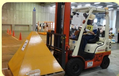
在安全驾驶情况下， 展示叉车操作技能。

参赛者在指定的路线（如图）内，将货物在10分钟内进行搬运和堆存。货物都是在三角锥的顶部，放着细长管，非常的不稳定。这就像精密仪器一样，比如说特别小的冲击也会受到影响，特别准备了这样的货物。大多数参赛者，都为了不让管子倒下来，在搬运货物上下了苦功夫。