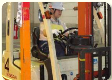
操作叉车的女员工。

7月31日，第三次IACT铲车安全驾驶比赛，在成田机场货运区第四货运大楼举行。本次比赛，以加强铲车操作人员的守法精神和安全意识，提高驾驶操作技能，并确立安全作业及推进防止工业事故为目的举行。本次大会，从进出口各部门选拔出20个选手参加，在客户航空公司，保险公司，成田国际机场公司等来宾及员工面前，展示了日常培训出来的业务技术。