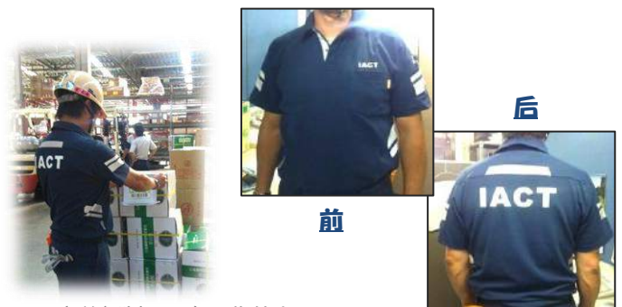
穿着新制服正在工作的上屋员工。

实际上可以从穿着新制服的工作人员那里听到很好的感想。一位员工说【新制服穿上舒服，样式也很喜欢】