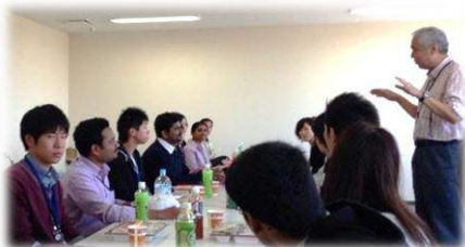
在成田IACT物流中心，新入社社员和IBS职员一起午餐会

入社仪式结束后，全体新入社社员们，又一次表达了作为社会人，努力工作的决心。加入了新的生力军后，IACT全体员工，今后将更努力地为客户提供高质量的服务。