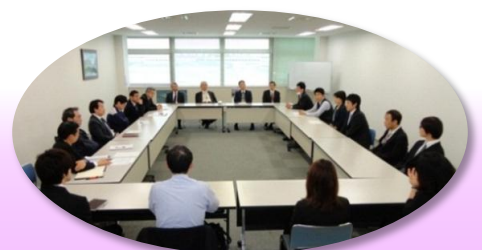
派遣人员和IACT董事会成员

中心株式会社(NACCS)等公司派出派遣职员。现在10个公司中，有18名员工正在被派遣中，在此，这次参加意见交流会的职员，向社长及董事们报告了现在担当的业务，及关于派遣中得到的经验。