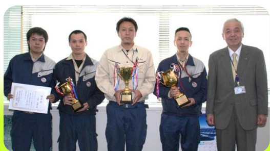
在表彰仪式上,IACT的组员