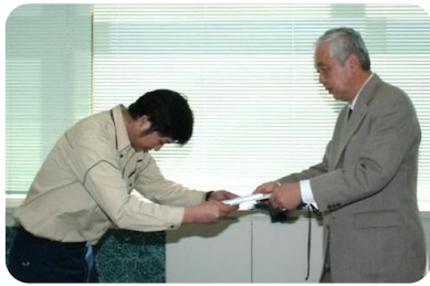
社长给得奖者办发表彰状。