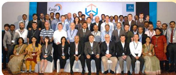
IBS Cargo Forum (特里凡得琅, 印度) — 1月24日・25日