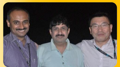
森田氏（下一期的主要基础系统的研发）