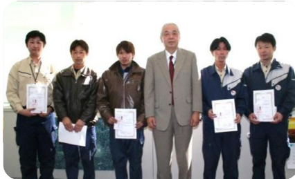
第二季度「业务改善提案表彰仪式」上